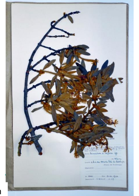
VUB, plant herbarium