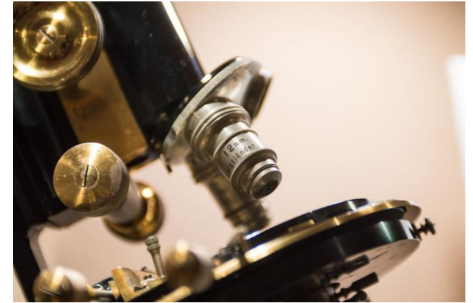
UAntwerpen, microscoop uit de Gevaert collectie