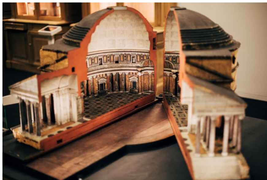
UGent, Kurkmaquette van het Pantheon, gerestaureerd door multidisciplinair team (CT-onderzoek, materialenonderzoek, archeologisch/architecturaal onderzoek)