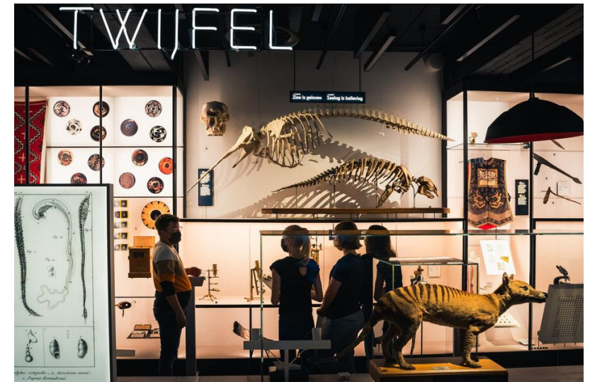
UGent, Gents UniversiteitsMuseum (GUM), rondleiding door MUST (Museum Student Team)