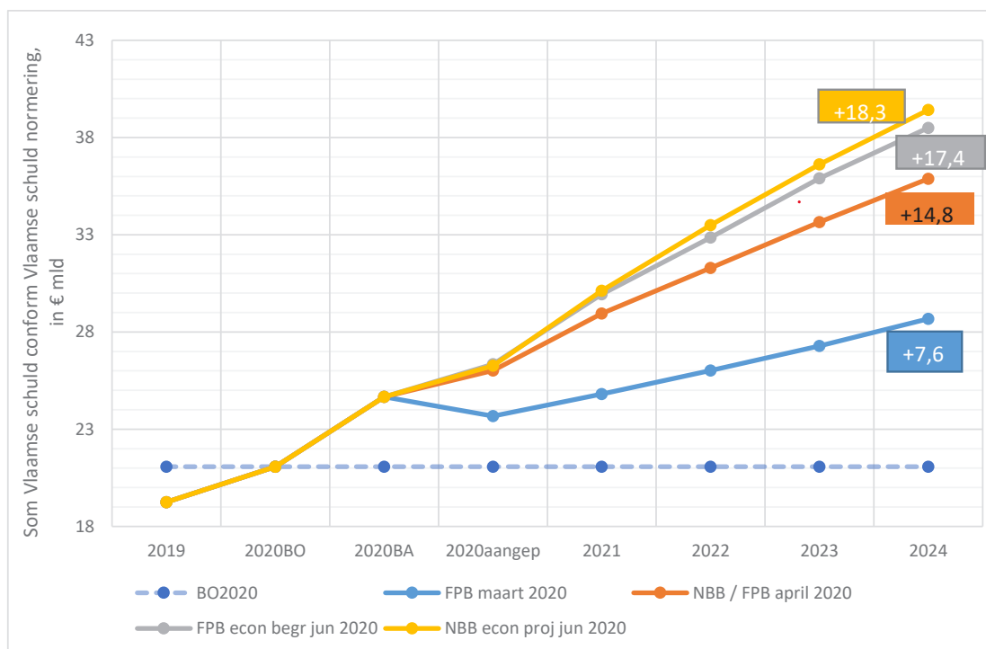
Figuur 2: Vlaamse overheid, SERV-ramingen gebaseerd op recente macro-economische scenario's 10 aangevuld met beschikbare gegevens tot juni 2020, som Vlaamse schuld conform Vlaamse schuldnormering, in € mld

In de raming gebaseerd op het eerste scenario (Planbureau van maart 2020) groeit de geconsolideerde schuld voornamelijk in crisisjaar 2020 sterk aan (€ +4,4 mld), waarna de jaarlijkse gemiddelde toename van de netto-schuld tussen 2021-2024 in absolute termen rond de € 1,2 mld ligt. Einde 2024 is er bij ongewijzigd beleid voor € 7,6 mld aan schuld bijgekomen ten opzichte van de initiële begroting 2020. Er wordt verondersteld dat de Vlaamse ontvangsten in deze periode relatief weinig beïnvloed worden door de coronacrisis, ook niet in 2020. Er wordt immers uitgegaan van een zeer korte recessie in de eerste helft van 2020, gevolgd door een ongeveer gelijkaardig herstel in de tweede helft van 2020. Doorheen de legislatuur zou de Vlaamse schuldnormering ruimschoots gehaald worden, al neemt de verhouding van de schuld tot de ontvangsten jaarlijks in beperkte mate toe (tot 58,2% in 2024).