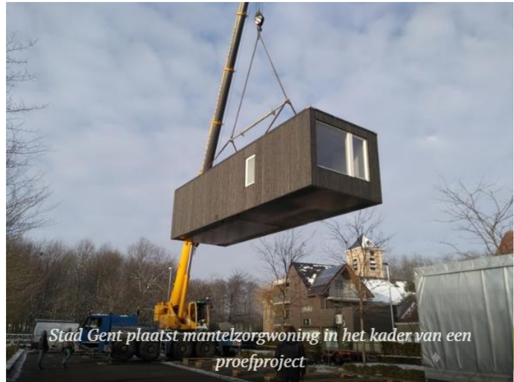
Stad Gent plaatst mantelzorgwoning in het kader van een proefproject