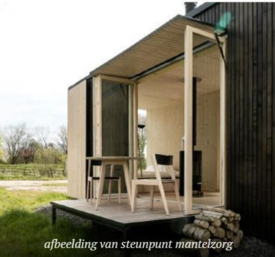
afbeelding van steunpunt mantelzorg