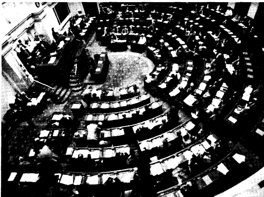
De leden van de Raad spraken zich op 25 februari uit over talrijke ontwerpen van decreet en met redenen omklede moties