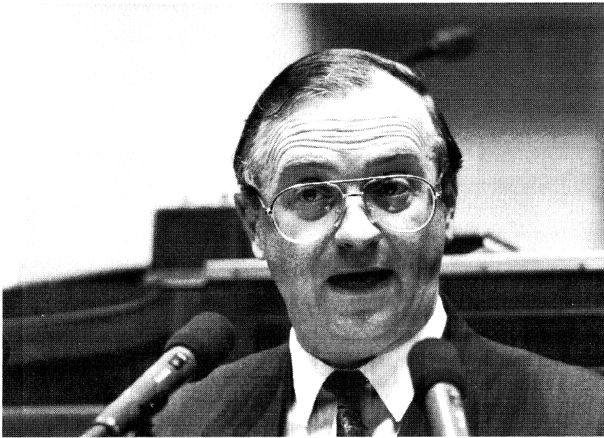
Minister-president Luc Van den Brande (CVP) kreeg actuele vragen over de campagne "Wegwijs in Vlaanderen" en de stand van zaken in het reconversiedossier van het Waasland

kozen Vlaams parlement, wil benadrukken.