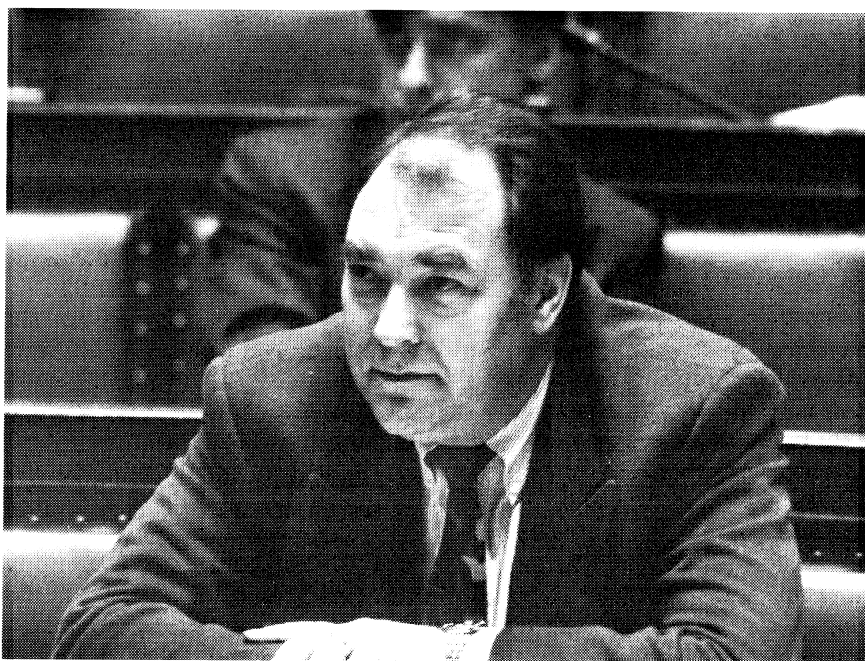
Het ontwerp van decreet betreffende de bodemsanering dat dooi- minister Norbert De Batselier (SP) werd ingediend, kreeg de goedkeuring van de Raad