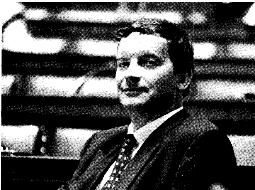
Minister Johan Sauwens (VU) verdedigde zijn ontwerp van decreet tot bescherming van monumenten en stads- en dorpsgezichten

§ 3. De personen die conform § 1 van dit artikel, in kennis werden gesteld van het besluit, geven bij ter post aangetekende brief kennis aan de huurders of de bewoners van het besluit dat hun betekend werd, binnen tien dagen te rekenen vanaf de datum van de afgifte ter post van de betekening op straffe van hoofdelijke aansprakelijkheid voor het herstel