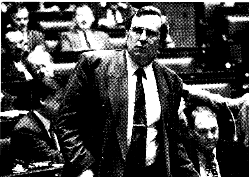
Onderwijsminister Luc Van den Bossche (SP) verdedigde zijn ontwerp van decreet betreffende de ontwikkelingsdoelen en eindtermen van het gewoon kleuter- en lager onderwijs

Ofwel gaan de Vlaamse mensen, en allereerst de Vlaamse onderwijsmensen, tegen uw zevenhonderd ontwik-