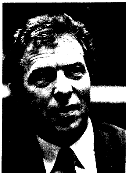
Minister T. Kelchtermans (CVP) werd geïnterpelleerd door de Kamerleden H. Van Dienderen (Agalev) en P. Van Grembergen (VU) over het vrachtwagenvignet

voorgesteld. De vordering van het dossier stond bij de federale regering op dat moment nog nergens. Toen heeft de federale regering ook gevraagd een rustpauze in te lassen, omdat zij ervan uitging dat de toepassing van de richtlijn neerkwam op een verkeersbelasting waarvan zij de opbrengsten opstreek. Zij ontkende de verbondenheid met de gewesten niet, maar voor de federale regering was dit van ondergeschikt belang.