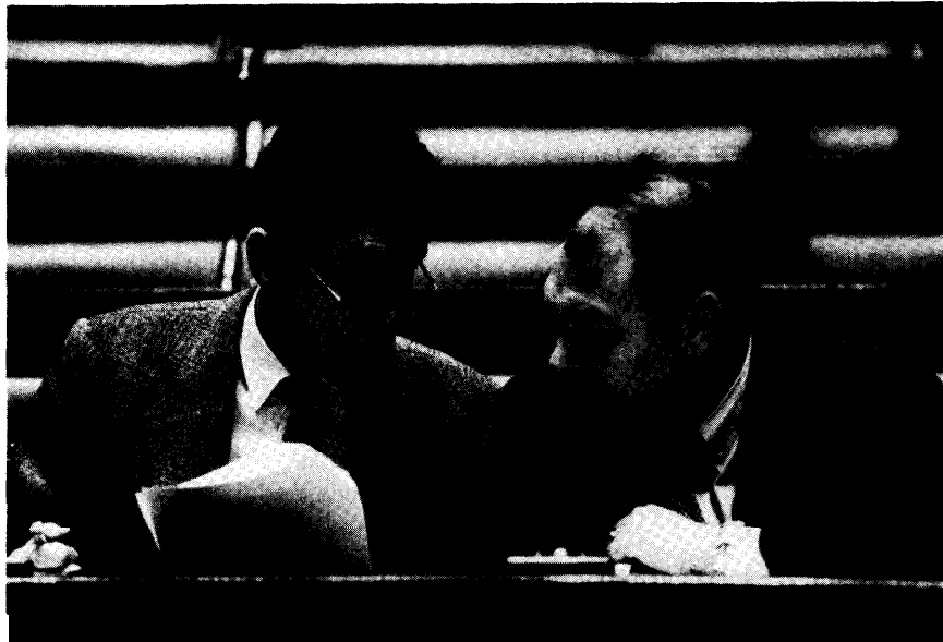
VU-Senator Hugo Schiltz, links naast SP-minister Norbert De Batselier, bestemde het debat over het Project Vlaanderen-Europa 2002 als een vrijblijvend colloquium

Bovendien is er het feit – de heer De Vlieghere heeft het bijvoorbeeld over de dubbeltelling van sommige kredieten in de post onderwijs ; wij zullen dat technisch in de commissie moeten beoordelen - dat sommige kredieten op een andere boekhoudkundige wijze worden verwerkt. Vandaar dat het noodzakelijk is de cijfers op een gelijkaardige wijze te laten beoordelen door zowel het Nationaal Instituut voor de Statistiek, de Hoge Raad van Financiën, de federale regering, de Vlaamse regering, het federaal parlement als de Vlaamse Raad. Dan zullen wij gezamenlijk tot de vaststelling komen dat Vlaanderen inderdaad een correct begrotingsbeleid heeft gevoerd waarbij de beschikbare middelen volgens de ons opgelegde normen worden verdeeld om de bestaande noden te lenigen.