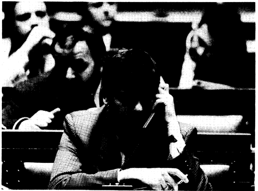
VB-fractie leider Filip Dewinter pleitte ervoor dat de Raad zich minimaal achter de oproep tot het verlenen van amnestie zou scharen