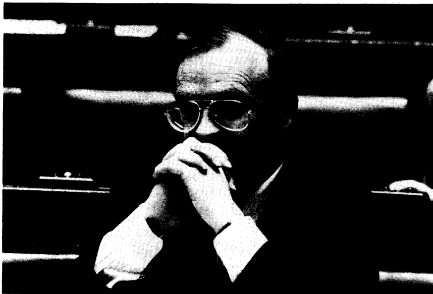
Minister-president Luc Van den Brande (CVP) kreeg tijdens het vragenuurtje vragen over het Konver-programma, de benoemingspolitiek in Vlaamse overheidsinstellingen, de betaalde mededelingen van de Vlaamse regering in de dagen weekbladpers, de privatisering van Belgacom en de gezondheidsindex

ten enerzijds en de beheerstructuren en andere instellingen van KS anderzijds. De aanbeveling werd gedaan om de mensen die voor april 1993 deel uitmaakten van de beheerraden hun mandaat te ontnemen. U hebt met veel ruchtbaarheid in de pers nieuwe structuren aangekondigd, wat ook uw plicht is als Vlaamse regering.