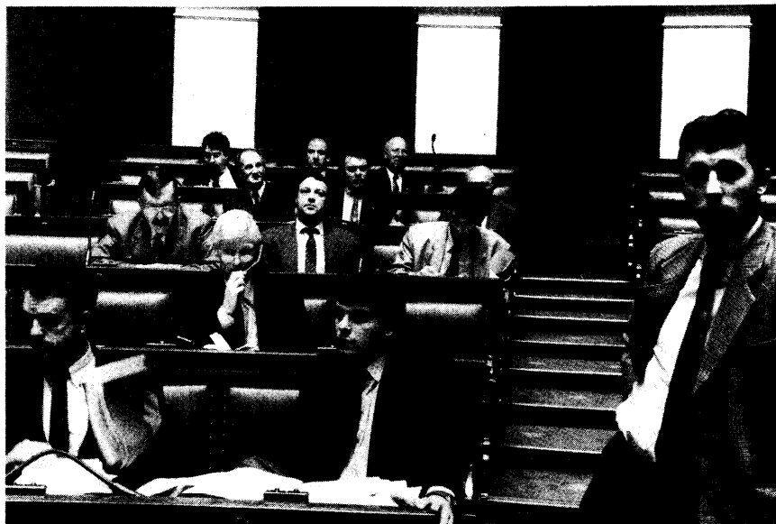
VB-Kamerlid Joris Van Hauthem, rechtstaand naast zijn fractie, interpelleerde samen met VU-fractie leider Paul Van Grembergen minister-president Luc Van den Brande (CVP) over het uitblijven van het wegwerken van de niet-objectief verklaarbare transfers van Vlaanderen naar Wallonië in de sociale zekerheid