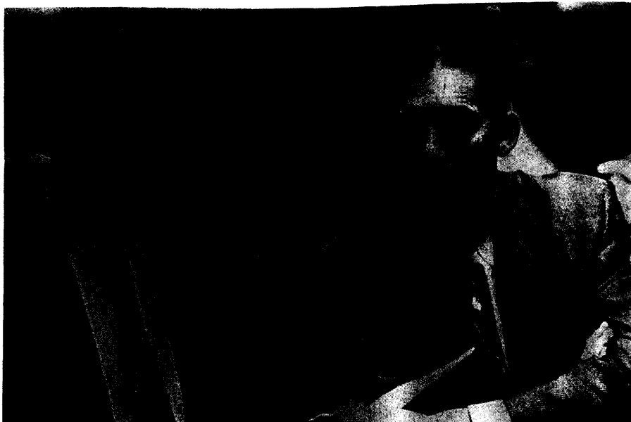
Minister T. Kelchtermans (CVP), Vlaamse minister van Openbare Werken, Ruimtelijke Ordening en Binnenlandse Aangelegenheden, werd tijdens het vragenuurtje druk ondervraagd over onder meer de N 58, de E 40, de slijbstortproblematiek en het gemeentelijk referendum in Voeren. Rechts fractiegenoot H. Brouns

U motiveert uw vernietiging of uw verzoek aan de gouverneur om het besluit te vernietigen vanuit de motivatie van een overtreding van de taalwetgeving. Ik spreek u daarin niet tegen. Is er niet nog een andere motivatie om dergelijke daad te verbieden, namelijk het feit dat de gemeen-