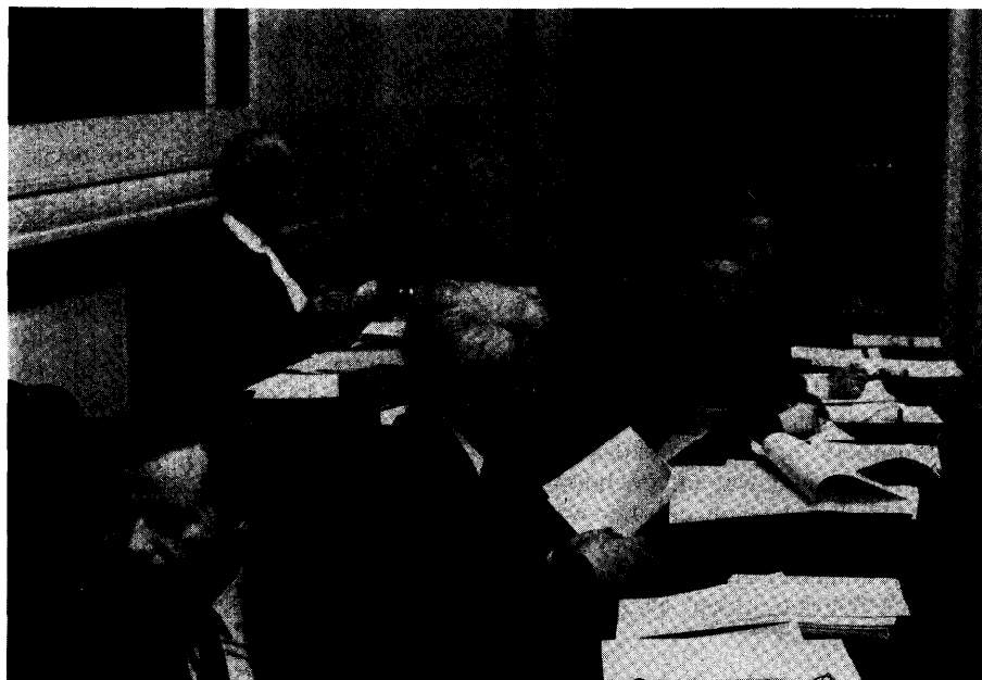
Personeel belast met de redactie van de Handelingen (achteraan) en het Beknopt Verslag (vooraan) van de Vlaamse Raad

Bij het verbod om tussen 2 november en 15 februari nog dierlijke mest te spreiden heb ik twee vragen :