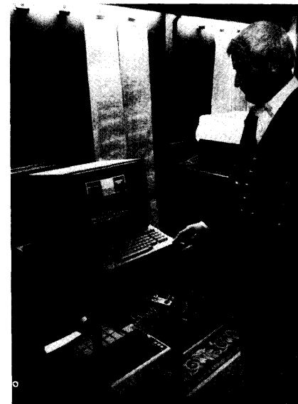
De BISTEL-apparatuur in werking