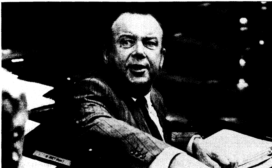
De Raad boog zich over het voorstel van decreet van Eerste Ondervoorzitter M. Olivier (CVP) houdende vaststelling van het wapen, de vlag, het volkslied en de feestdag van de Vlaamse Gemeenschap. Op 4 onthoudingen na genoot het voorstel de unanieme instemming van de Raad

de Minister, collega's, zoals op 30 maart 1988 mag ik vandaag verslag uitbrengen van de werkzaamheden in de Commissie voor Cultuur. Toen werd namelijk in plenaire vergadering het ontwerp van decreet besproken dat zou worden goedgekeurd op 30 april 1988 en dat het wapen, de vlag, het volkslied en de feestdag van de Vlaamse Gemeenschap bepaalde.