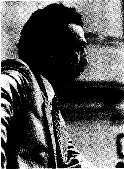
De Voorzitter van de Vlaamse Raad, de heer L. Vanvelthoven (SP), leidt de stemverrichtingen