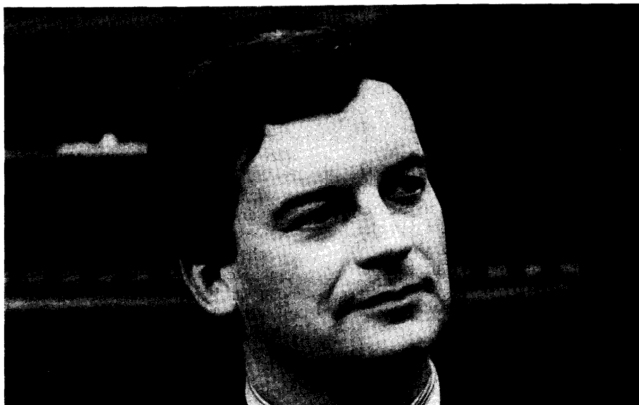
De Gemeenschapsminister van Openbare Werken en Verkeer J. Sauwens (VU) vond dat zijn ontwerp-decreet de gelegenheid biedt om het verplaatsings- en mobiliteitsprobleem van de Vlaamse belastingbetaler op te lossen

Vlaamse Executieve en de maatschappij zullen worden opgesplitst per exploitatie-eenheid.