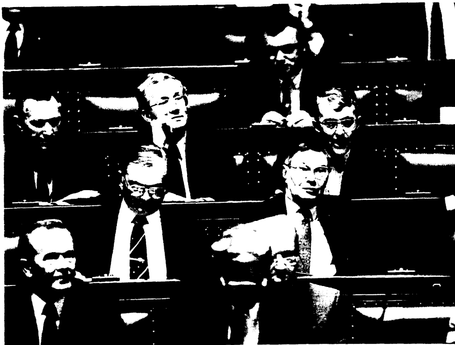
Leden van de CVP-fractie

Trouwens, in dat programmadecreet is eveneens een wijziging voorzien van de wet van 26 april 1971 op de