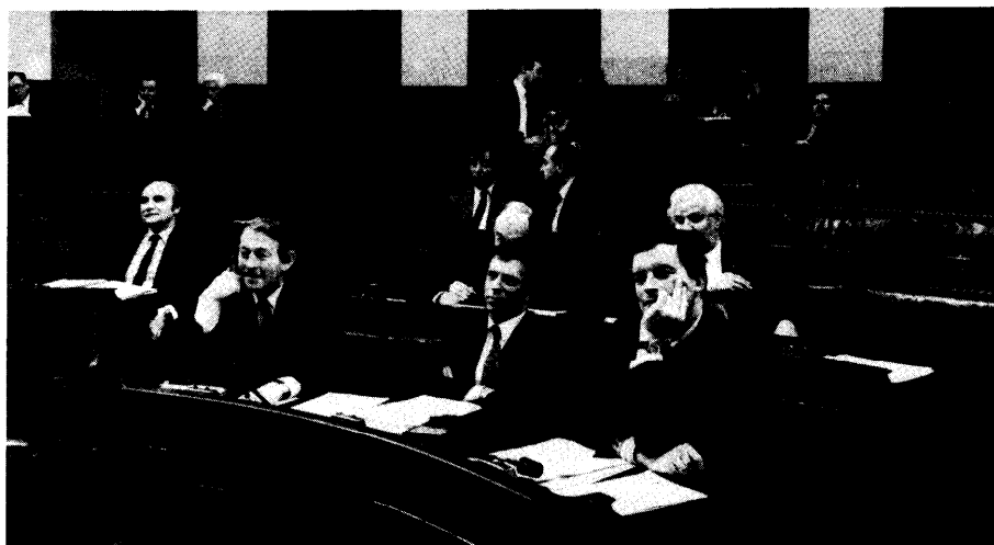
Als illustratie inzake de samenwerking en het overleg in de Executieve antwoordde (rechts) Minister J. Sauwens (VU) op het interpellatiegeheel gewijd aan de Gentse havenproblematiek mede namens zijn collega (midden) Minister T. Kelchtermans (CVP). Voorgond links : Minister J. Lenssens (CVP). Op de achtergrond : (links) PVV-fractievoorzitter A. Denys en (achter het ministeriële trio) leden van de VU-fractie en van het Vlaams Blok

De Barco-beslissing van de Executieve is hiermee om de volgende redenen in tegenspraak. Ten eerste, verplicht men de GIMV om de Barco-aandelen in één grote Vlaamse electronica-holding onder te brengen. Dit is geen gewone overgangsbepaling, maar een zeer verre gaande optie in het te volgen economisch be-