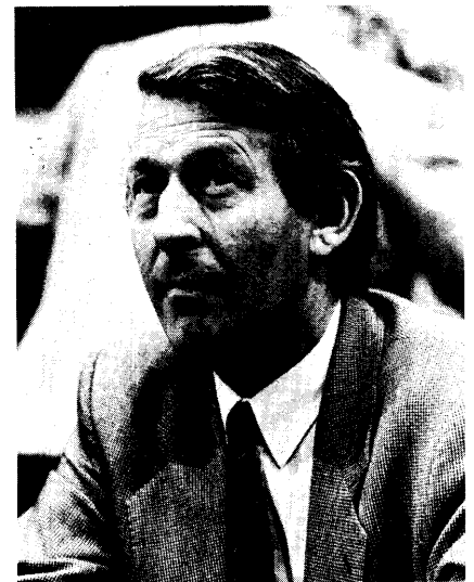
Minister J. Lenssens (CVP) bij de eindstemming over zijn decreet-milieuvergunning

Mag ik veronderstellen dat de uitslag van de stemming over het amendement bij artikel 2 hier mag gelden ? (Instemming)