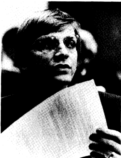
PW- Volksvertegenwoordiger G. Verhofstadt houdt in het debat over het kabeldecreet zijn maiden-speech voor de Vlaamse Raad

Ik wens mij geen waarde-oordelen toe te eigenen en ik weiger dus te doen zoals de Volksunie en te praten over Dallas en Dynasty. Alleen moeten we zeer goed beseffen dat Dynasty en Dallas, hoe onschuldig ook en hoe ook bekeken door de Voorzitter van de Vlaamse Raad – dat merk ik aan de opmerkingen die ik achter mij hoor – toch cultuurdragers zijn. „Sans dire mot” geven ze ookwaarden door. Veel subliemer dan de wijze waarop bijvoorbeeld traditioneel links zijn boodschap doorgeeft. Contradictorisch genoeg is het vooral langs de linkerzijde dat in deze het preken in is.