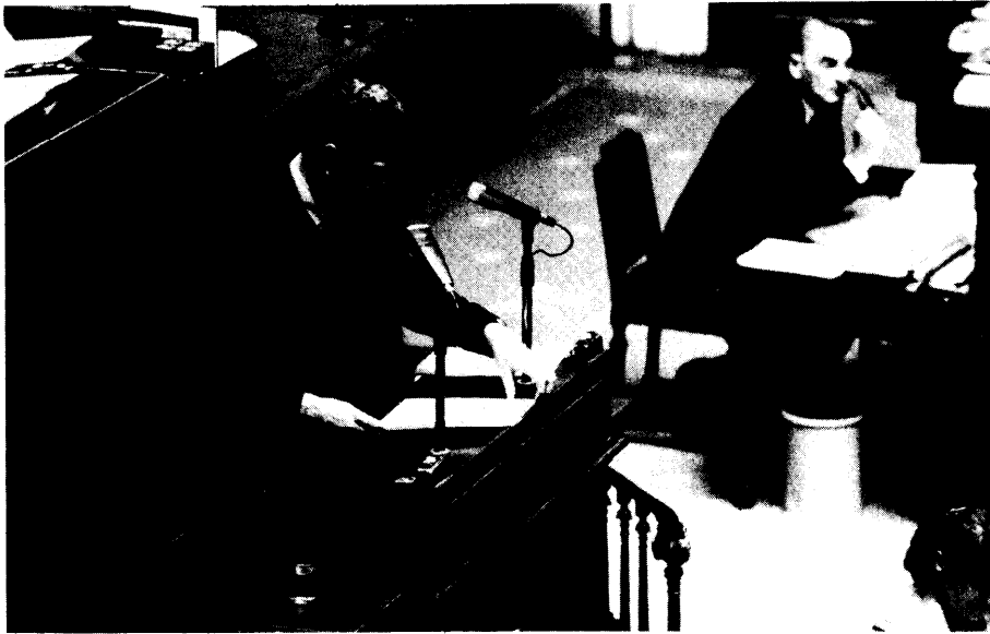
In een dringende vraag tot Minister K. Poma (PVV) peilt Senator W. Seeuws (SP) de reddingsmogelijkheden voor het musical-theater Arena. Nadien ondervroeg hij ook nog Minister J. Buchmann (PVV) over de taken van de Gewestelijke Comit es voor de Huisvesting

sen per jaar, hoger dan in Nederland, tussen de 4.000 en de 5.000 vossen, dat een vergelijkbare vossenpopulatie heeft. Het is dan ook noodzakelijk om net als enkele jaren terug de jacht op de vos te staken in de Provincies Oost- en West-Vlaanderen en Antwerpen evenals de Provincies waar de vos eerder zeldzaam is.