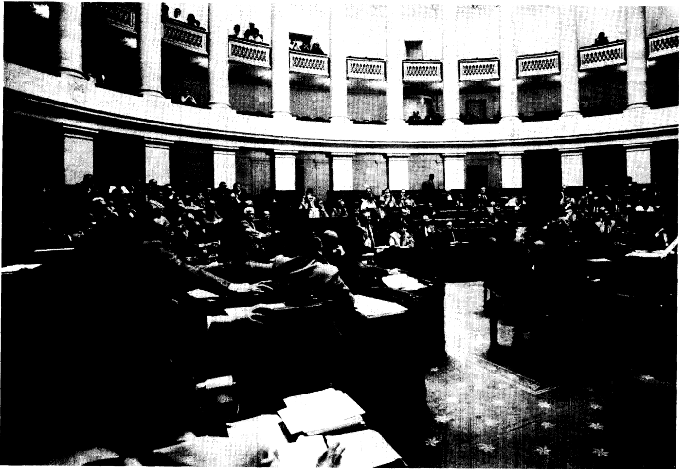
Algemeen gezicht. Voorgrond links : een deel van de SP-fractie. Achtergrond links : de PVV-fractie. Midden : de VU-fractie. Rechts : een gedeelte van de CVP-fractie

woord hebben verstrekt. Het waren die groepen die binding hadden met de familiebladen en met de weekbladen voor de vrouwen, omdat blijkt dat juist in de reclame bij de TV de familie en de vrouw het meest wordt aangesproken. Zij zouden dus een groot verlies lijden aan reclame-inkomsten. Omdat op dat ogenblik de vertegenwoordigers van de geschreven pers mij hebben gezegd dat zij niet unaniem gunstig waren, heb ik gezegd dat voor mij het dossier OTV gesloten was. Maar, mijnheer Van Elewycck vergist zich wanneer hij denkt dat ik daarmee bedoel dat het hele dossier is