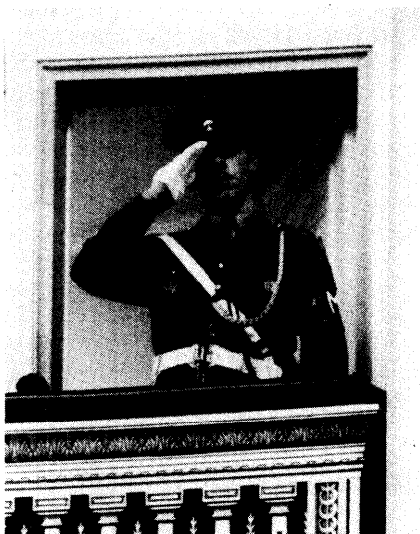
Net vóór de aanvang van de vergadering. De militaire wacht van het Paleis der Natie groet de Voorzitter van de Raad wanneer laatstgenoemde de vergaderzaal binnentreedt

ling aanslepen en zelfs uitbreiding nemen.