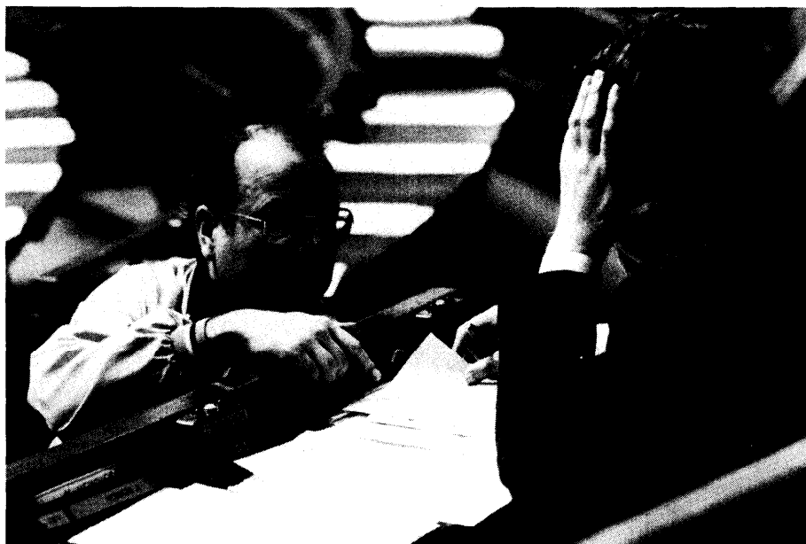
VU-Volksvertegenwoordiger W. Kuijpers, die Minister P. Akkermans (CVP) onder-voeg over mogelijke natuurschending door Gauloises-Yamaha-Motoland op de Haksberg te Tielt- Winge, onderhoudt zich even met zijn fractiegenoot F. Van Steenkiste

té verzocht een schattingsverslag ter zake op te maken ; verslag dat op 27 december 1983 voorgelegd werd. De schatting bedraagt 88 miljoen.