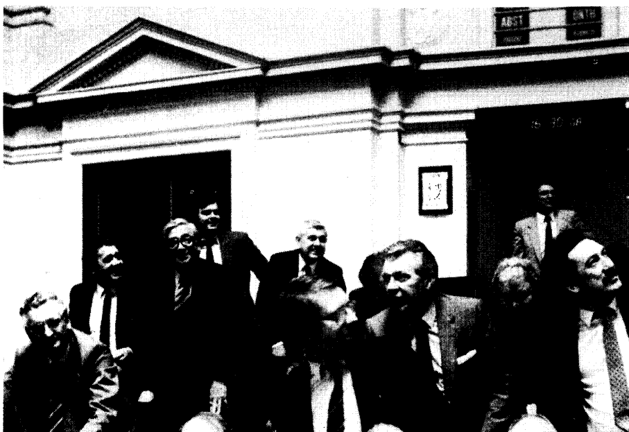
Enkele SP-leden tijdens een stemming bij zitten en opstaan

doen ten opzichte van diegenen die in de Voerstreek op brutale wijze behandeld worden en waar kinderen gebruikt worden als chantagemiddel in een politiek van terreur.