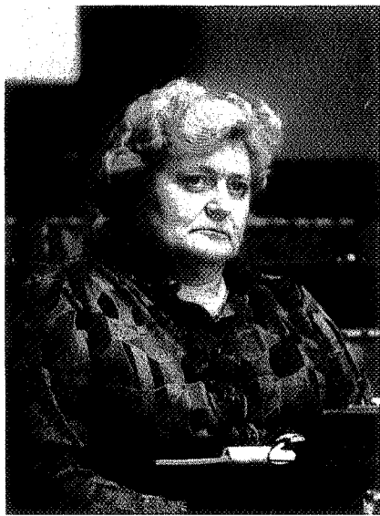
In verband met milieugevaren stelde mevrouw O. Lefebvre (SP) een drietal mondelinge vragen aan Gemeenschapsminister J. Lenssens (CVP)

1. Is het conflict een belangen- of een bevoegdheidsconflict ?