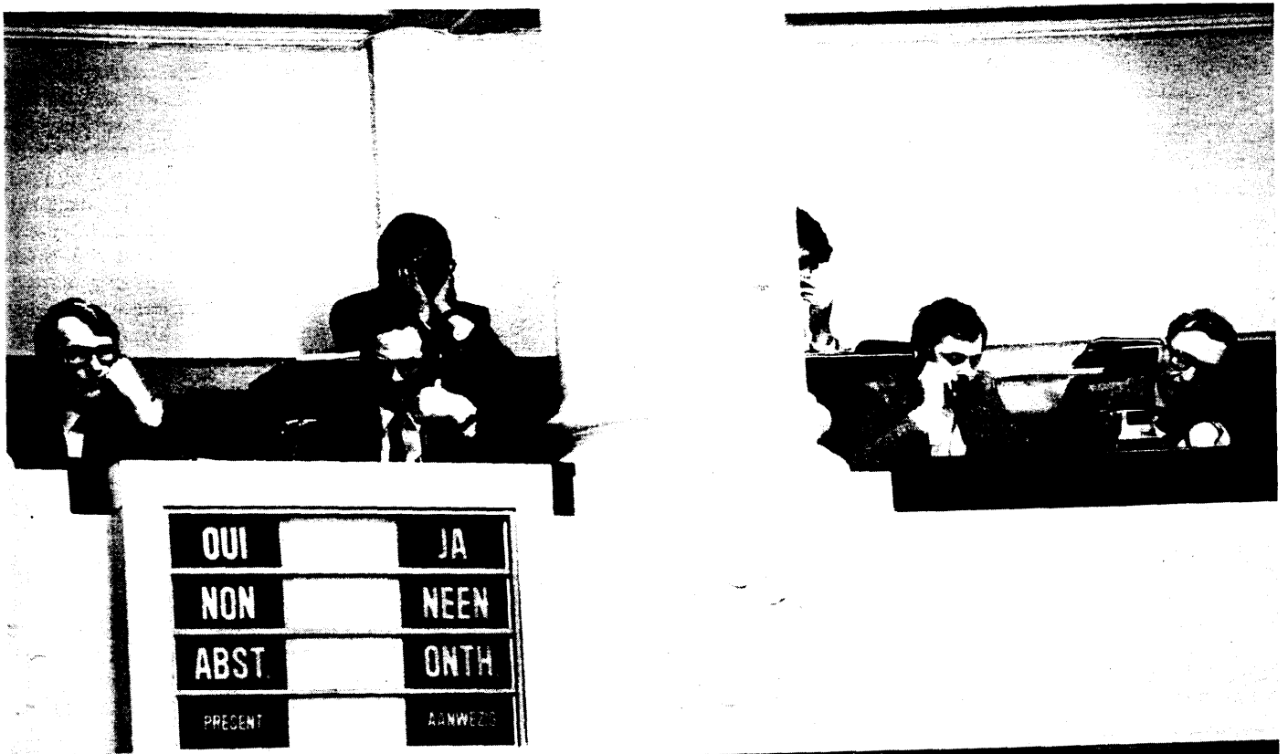
In de ambtenarentribune wordt het begrotingsdebat gevolgd door kabinetmedewerkers van de betrokken ministers

Dat is de bedoeling van deze verzekering. Wij zijn ervan overtuigd dat het