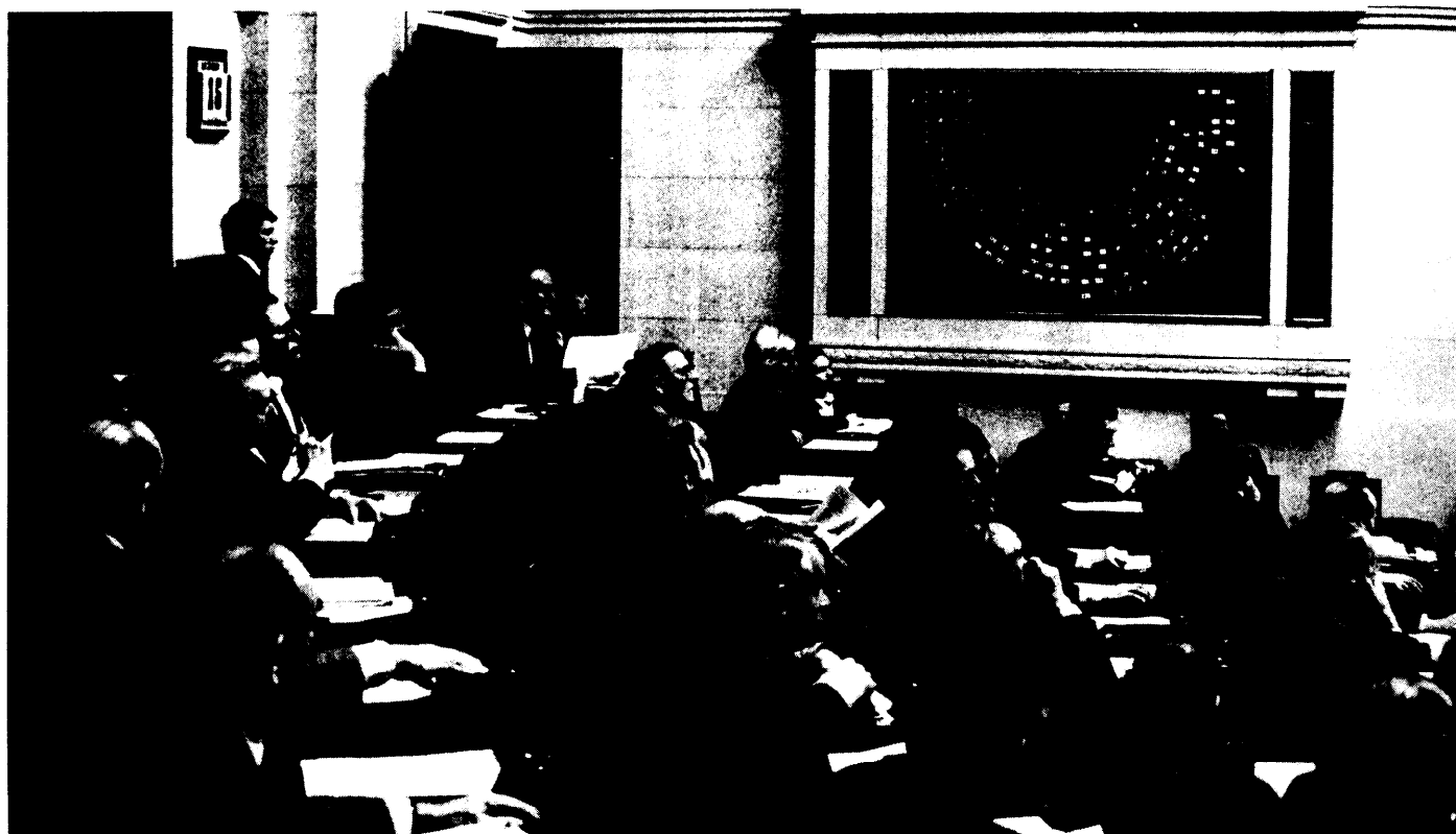
Deelgezicht op de CVP-fractie tijdens de hoofdelijke stemmingen. Achtergrond : het kleurlichtbord waarvan kan worden afgelezen in welke zin de leden hun stem uitbrengen

beidsgeneeskundige dienst van de werkgever ter zake om advies te verzoeken, waarbij ook vertraging kan ontstaan.