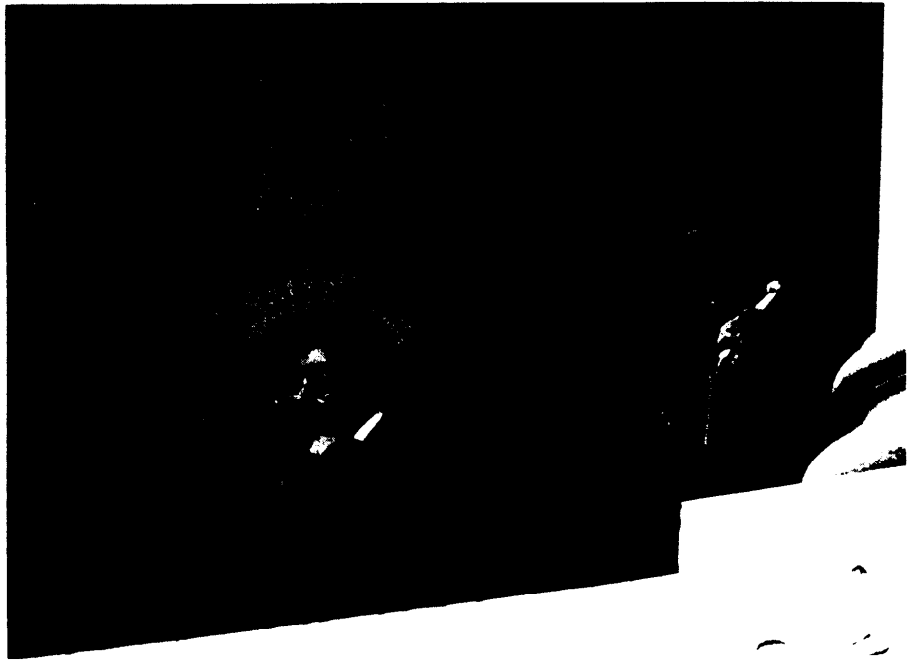
Vanuit de persbureau volgen oren en ogen van de pers het gebeuren in het halfroond

Wat niet wordt gerespecteerd is de morele verbintenis die toen door de centrale regering werd aangegaan om de te voorziene financieringsbehoeften van de Gemeenschappen en Gewesten, correlatief met de lasten die op dat ogenblik reeds waren vastgelegd en dus voorzienbaar waren, via de ristorno's te laten oplossen, ver-