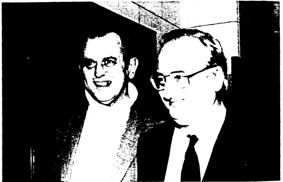
Het middernachtelijk uur is reeds ruim overschreden wanneer de vergadering ten einde loopt. Minister K. Poma (PVV) en Volksvertegenwoordiger J. Somers (VU) hebben er de glimlach niet bij verloren

Wat artikel 209 betreft, heb ik destijds aan de heer Dhoore de vraag gesteld hoeveel klinieken in het land bereid zullen zijn een aantal bedden op te offeren voor reconversie. Kent u de cijfers, mijnheer de Minister ? (Minister De Wulf knikt instemmend ) Men wil ongeveer 800 bedden vrijmaken voor reconversie naar verzorgingsbedden.