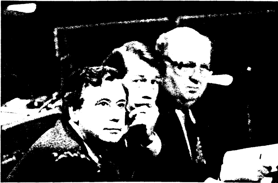
Leden van de Vlaamse Executieve tijdens het begrotingsdebat. Voorzitter-Minister G. Geens (CUP), Minister J. Lenssens (CVP) en Minister P. Akkermans (CVP)

de Staat dan komt dit eenvoudig omdat ze hun reserve moeten opgebruiken, ze moeten nu lenen om hun reserve aan te vullen en onderhoud te betalen enzovoort. Men zit nu zelfs in de onwettelijkheid want men verbruikt geld dat men leent, dat dus normaal van de leningsmachtiging komt, om administratiekosten en andere te betalen.