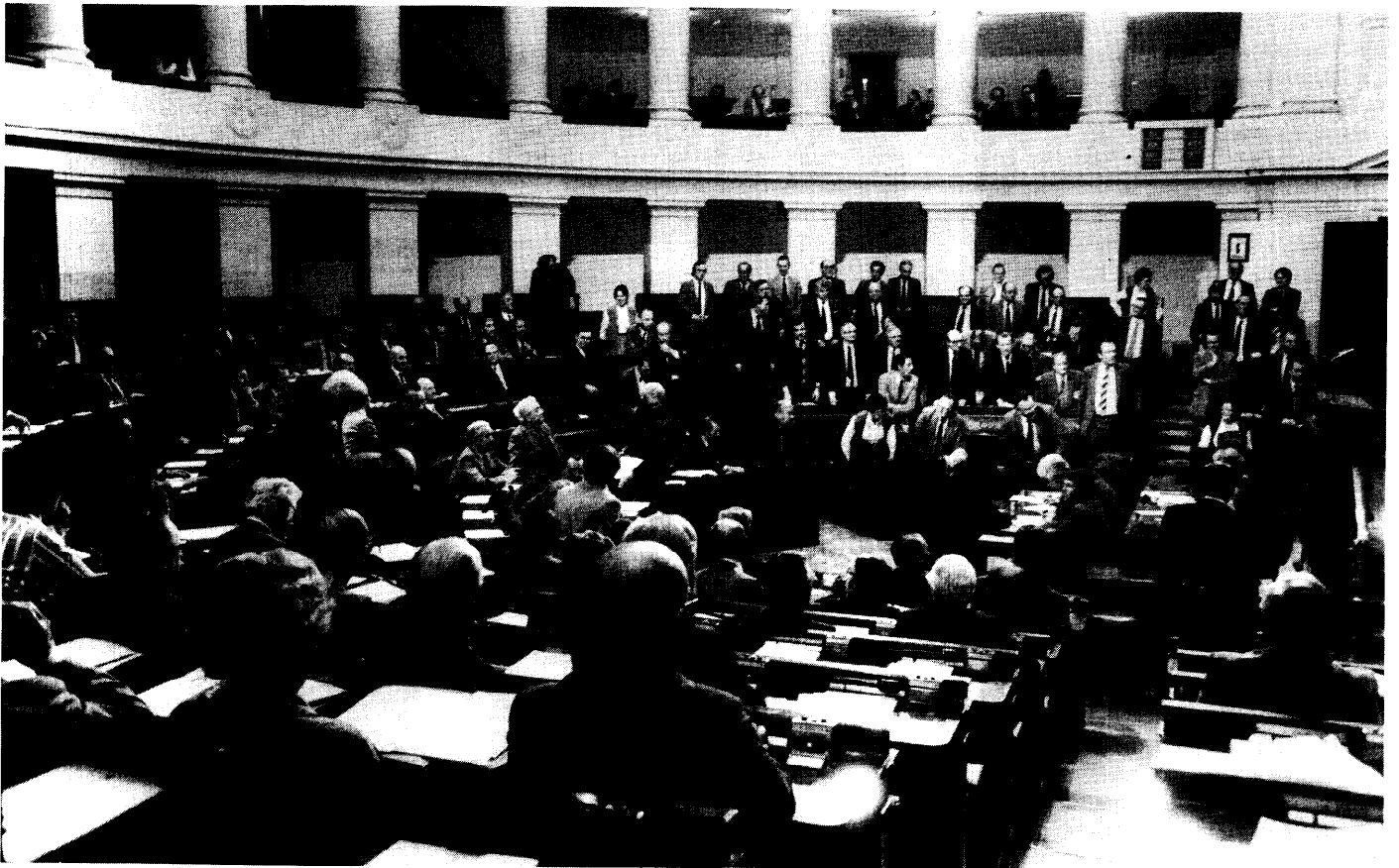
Een stemming bij zitten en opstaan

uit uw ambt moeten interesseren. Want, het is vanuit de winst- en verliesrekening per bedrijf, dat u een appreciatie, die ik u heb gevraagd, zou kunnen opbouwen.