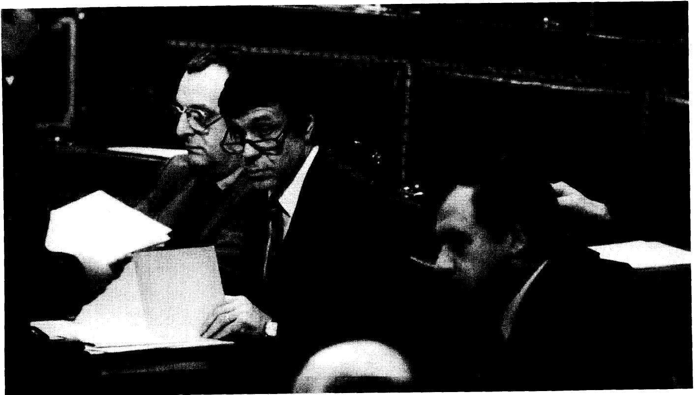
Leden van de Vlaamse Executieve tijdens het debat. Van links naar rechts : Minister J. Buchmann (PW, Minister H. Schiltz (VU) en Minister G. Geens (CVP), Voorzitter van de Vlaamse Executieve

Zoals het analoge artikel 78 van de Grondwet, waarvan het in feite een herschrijving uitmaakt, kan dit artikel als basis worden weerhouden voor het opdragen door de Vlaamse Raad van een normatieve bevoegdheid aan de Executieve om aangelegenheden te