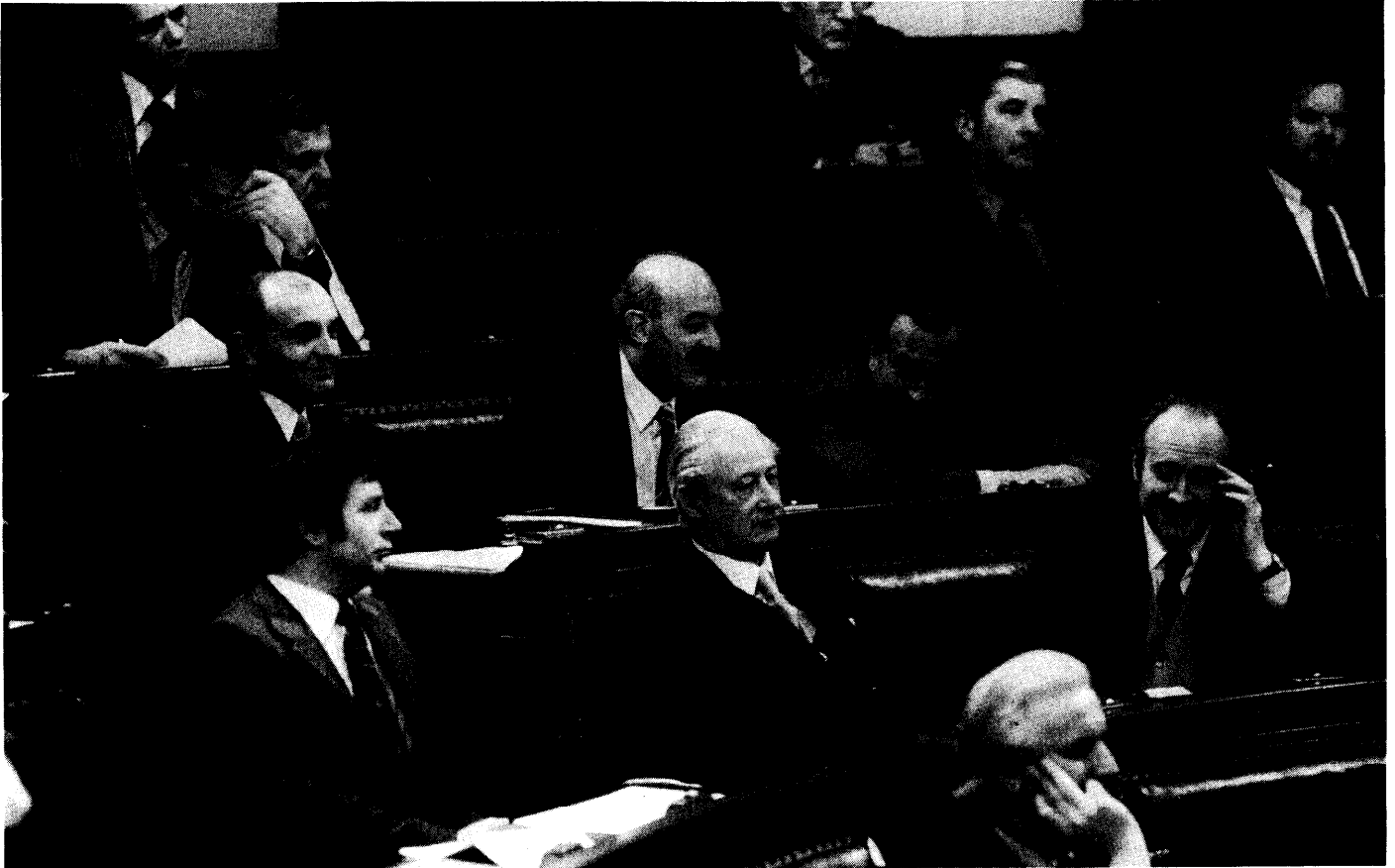
Een deel van de VU-fractie tijdens het debat over de Beleidsverklaring van de Vlaamse Executieve

De studies van het IHE leren ons dat met veel minder geld veel betere resultaten kunnen bereikt worden.