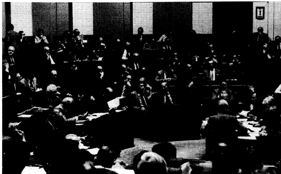
De Vlaamse Raad in openbare vergadering

Daarom werd in alle provincies de wens geuit dat er een verplichte hotelclassificatie zou worden ingevoerd. Men vraagt ons dat er tegen 1 januari 1983 zou overgegaan worden tot de uitbreiding van de Benelux hotelclassificatie die nu reeds bestaat maar die op vrijwillige basis wordt uitgevoerd. Deze wil men verplicht stellen. Dit is noodzakelijk om het imago van deze sector, zowel in het binnen- als in het buitenland, te verbeteren.