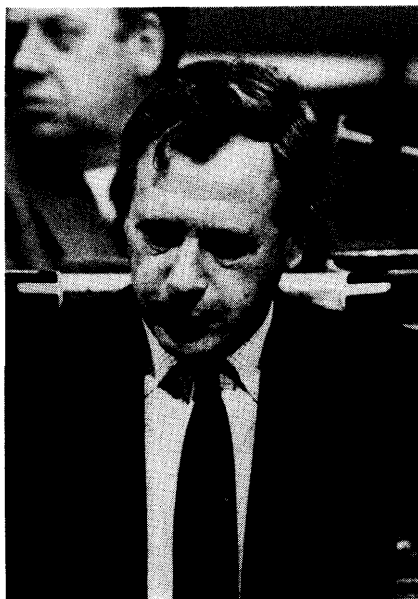
De heer G. Geens, (CVP), Minister van de Vlaamse Gemeenschap, Voorzitter van de Vlaamse Executieve, behandelt de motie van orde

De Voorzitter : Het incident is gesloten.