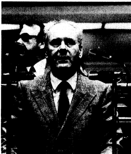
De heer M. Galle (SP), Minister van de Vlaamse Gemeenschap geeft uitleg bij de gestelde vraag

1980. Ikzelf kreeg van dit rapport pas inzagge op 17 oktober 1980. Op 27 oktober 1980 gaf ik de administratie opdracht hieromtrent een vergadering te plannen.