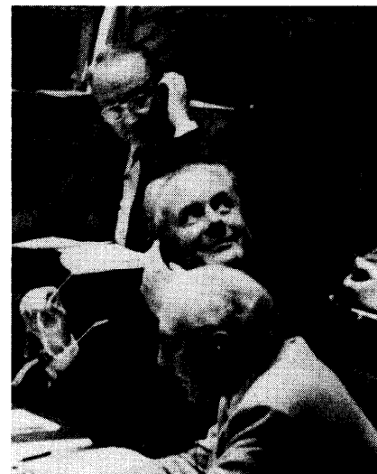
De heren M. Galle (SP), Minister van de Vlaamse Gemeenschap en W. Calewaert (SP), Minister van Nationale Opvoeding. Op de achtergrond de heer K. Poma (PVV), fractievoorzitter.

Voorzitter, het respect voor de democratische instellingen ligt ons allen nauw aan het hart. In dat verband heeft collega Poma ofwel te weinig ofwel teveel gezegd. Inderdaad, in zijn repliek heeft hij gezegd dat wat de minister heeft naar voren gebracht niet met de feiten overeenstemt. Hij heeft er zelfs aan toegevoegd : "natuurlijk niet". Dit choqueert mij een beetje. Ofwel zegt de heer Poma precies wat er in het relaas van de minister niet met de feiten strookt ofwel uit collega Poma deze zware beschuldiging niet. Eén van beide.