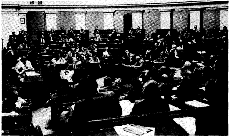
Algemeen gezicht op de vergaderzaal

uur opnieuw bijeen om onze agenda verder af te handelen.