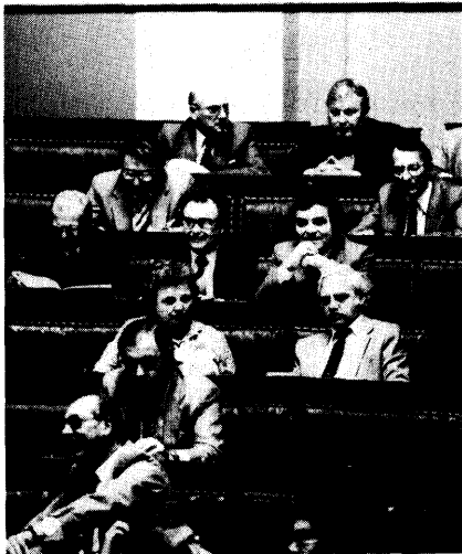
Een deel van de SP-fractie