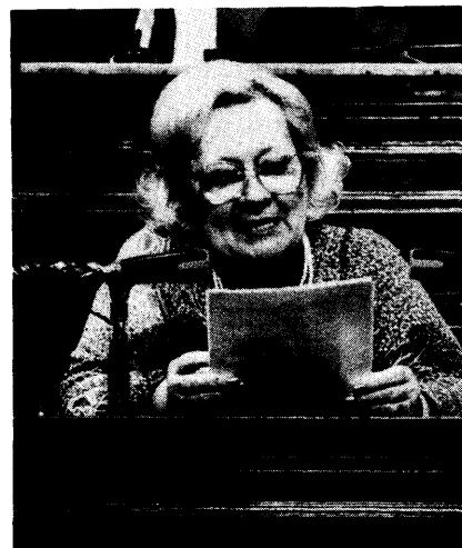
Mevrouw R. De Backer-Van Ocken (CVP), Staatssecretaris voor de Vlaamse Gemeenschap

Er werd ook gesproken over de mogelijkheid om de kijk- en luistergeld naar de gemeenschap te laten vloeien. Deze mogelijkheid bestaat inderdaad. Dit wil echter niet zeggen